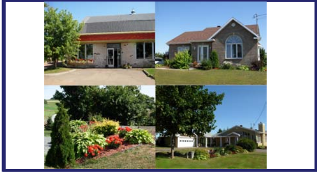
Ferme Ferme Ronier 309, Principale est