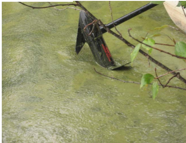
...SUR LE BORD DU LAC DURANT L'ÉTÉ (SITUATION SPORADIQUE)