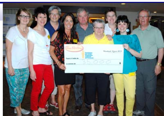
Le comité organisateur entoure la présidente d'honneur lors de la remise du chèque.