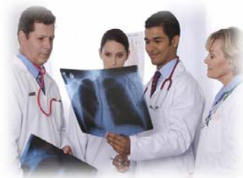
Centre de santé et de services sociaux de Rimouski-Neigette