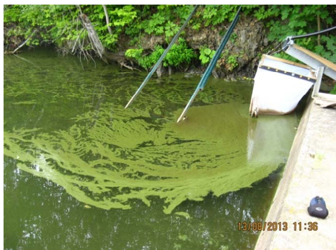
Explosion de cyanobactéries au lac à l'Anguille le 13 août dernier...secteur du barrage

Pour apprécier la photo consultez l'article sur le site Web http://www.stanaclet.qc.ca/journal/index.php