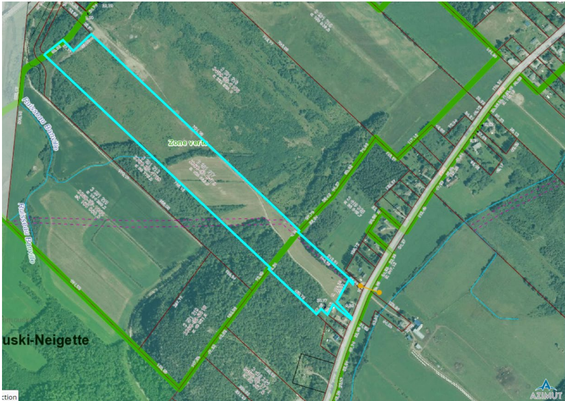
Photo azimut de la propriété

0, rang 3 OUEST, 3368-97-8479 à Saint-Anaclet-de-Lessard