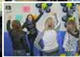
Jeunes bénévoles fêrees de décoration