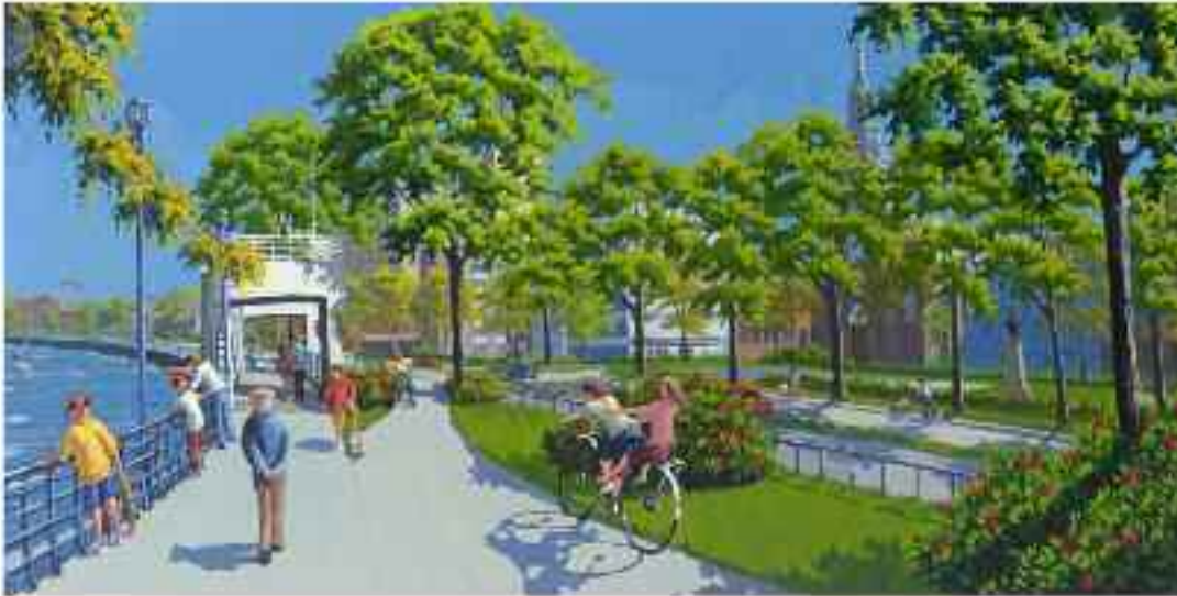
Artiste: Rémi Clark