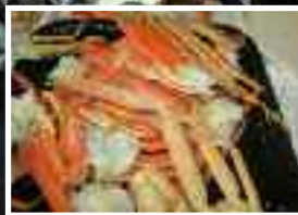
Crabe prêt à être dégusté