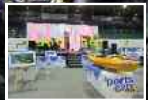
Des pièces d'encan toujours prisées des connaisseurs