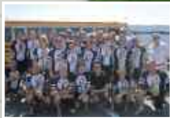
La caravane provinciale