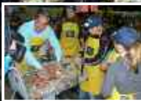
1, 2, 3 go