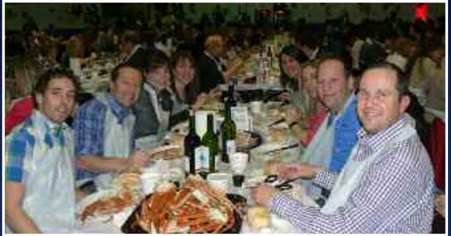
Des convives heureux et satisfaits