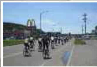
L'arrivée à La Pocatière