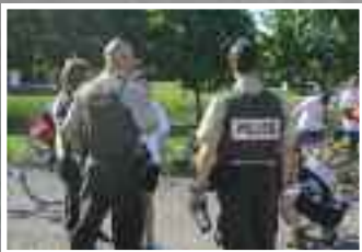
Les policiers et la sécurité