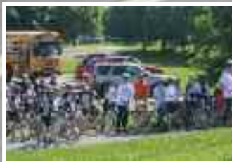
Le départ : Branle bas de combat