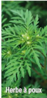
Herbe à poux