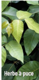
Herbe à puce